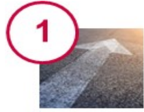
Engagement de la Direction