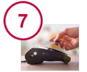
Gestion des paiements